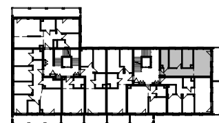
Rzut piętra 4