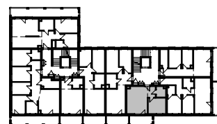
Rzut piętra 4