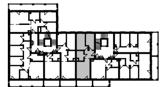
Rzut piętra 4